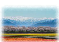
あさひ舟川「春の四重奏」 （富山県）