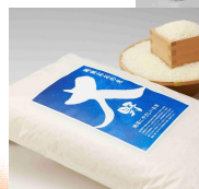
地球にやさしいお米