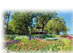
高知県立牧野植物園