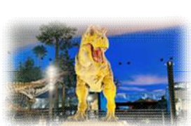
福井県立恐竜博物館