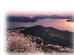
積善山「三千本桜」 （愛媛県）